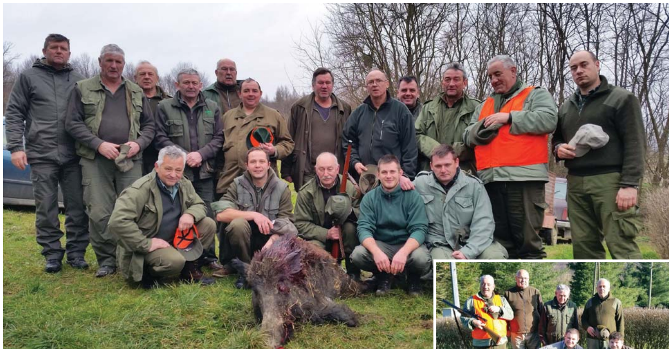
SRETAN USKRS SVIM MJEŠTANIMA OPĆINE NOVIGRAD PODRAVSKI ŽELI LOVAČKA UDRUGA "GOLUB"